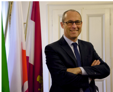
Ugo Rossi Presidente Provincia autonoma di Trento

La finalità di questa sesta edizione del Festival della famiglia è dibattere su un tema fortemente attuale e cioè la necessità di fare rete sul territorio per generare valore, sviluppo, innovazione. In una parola: crescita sociale ed economica . Le policy pubbliche non possono più indirizzare i loro piani utilizzando un unico paradigma, la mera gestione economica di bilancio, bensì adottare una visione più globale che includa anche i nodi delle reti di sistema generatrici di benessere sociale. Questo passaggio potrebbe innestare un mutamento qualitativo culturale, che apporterebbe nuova linfa alle reti istituzionali, economiche e personali che vivono, abitano e sviluppano il nostro territorio provinciale e la sua identità.