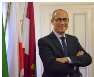
Ugo Rossi Presidente Provincia Autonoma di Trento

Le questioni legate al tema della conciliazione famiglia-lavoro impongono una riflessione ampia e articolata sui bisogni reali della popolazione, sulle aspettative profonde di coloro che hanno o condividono responsabilità di cura all'interno della famiglia e contemporaneamente hanno esigenze e vincoli professionali.